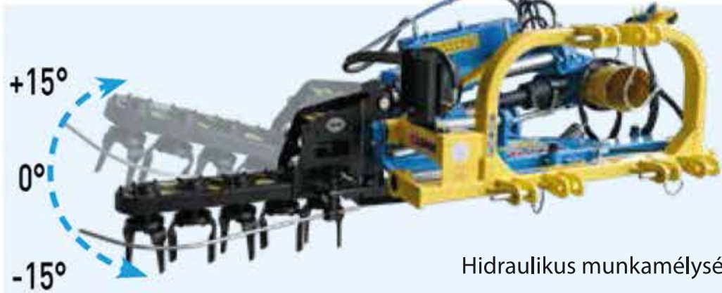
Hidraulikus munkamélység állítás a fej döntésével